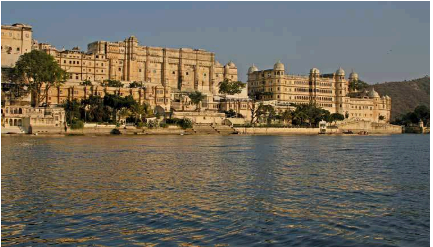
City Palace, Udaipur