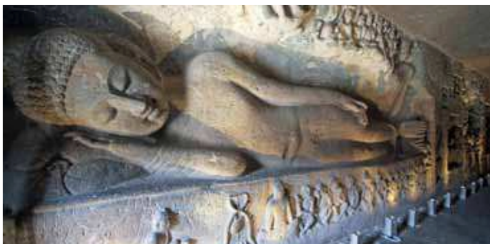
Buddha im Höhlentempel, Ajanta