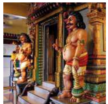
Tempel in Pattadakal

Ganztägige Fahrt im Privatwagen mit Chauffeur nach Goa.